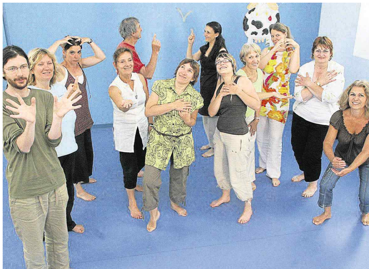
Pour l'instant, on mime un proverbe. Trois mimes pour un proverbe, c'est encore plus drôle quand on échange avec celui du voisin.

Les doigts sont des petits marteaux qui frappent le crâne ? « Écoutez les vibrations ! » Sur la gorge, les mains ressentent les résonances de la voix, selon qu'elle est haute ou basse. Le rapport avec le conte ? Comme le corps, « une histoire mérite d'être explorée. Et le conte est également une symphonie », explique Philippe Sizaïre en souriant. « On peut chuchoter, monter la voix, varier le volume. » À chacun de devenir son propre chef d'orchestre.